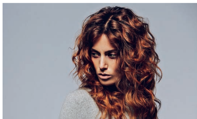
Power-Mähne! Bei diesem unfrisiert wirkenden Look sorgt die Stufung der langen Haare in Verbindung mit den plastischen Locken für eine noch voluminösere Wuschelmähne.

Neue Kreationen stehen für Natürlichkeit und Ungezähmtheit